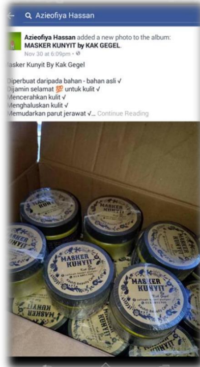
Caption : Sentiasa mengemaskini stok yang ada di laman Facebook/Wechat