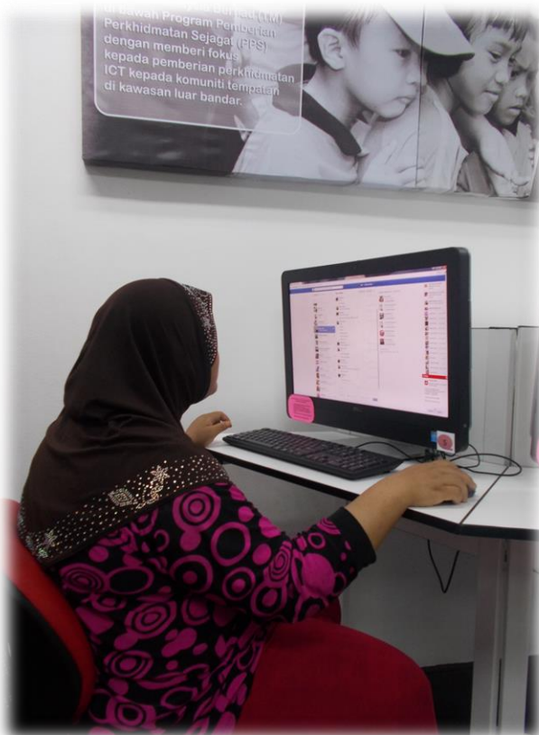
Gambar 3: Sering berkunjung ke PI bagi membalas komen/berinteraksi dengan pelanggan