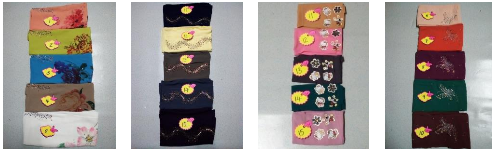
Caption : Menggunakan medium laman sosial untuk mendapatkan pelbagai jenis tudung keluaran terbaru dan turut menjual semula tudung tersebut di Facebook/Wechat.