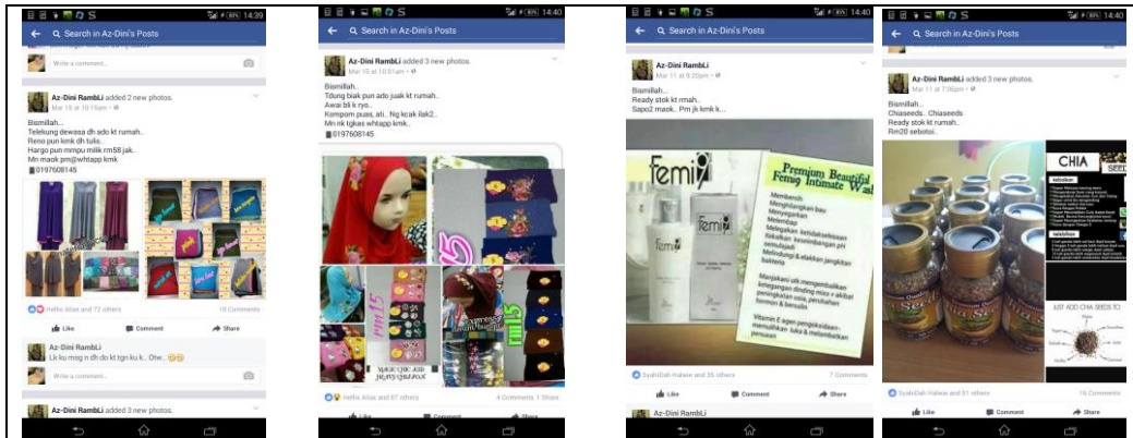
Caption : Promosi dilaman sosial Facebook